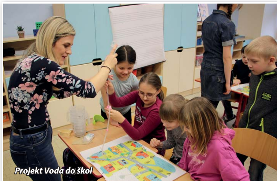
Projekt Voda do škol