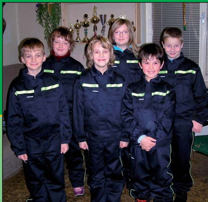
Mladí hasiči v nových uniformách