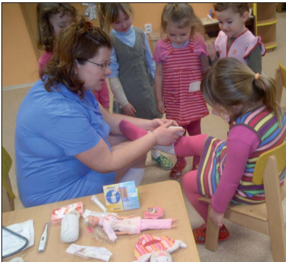
Zdravotní sestřička ve školce