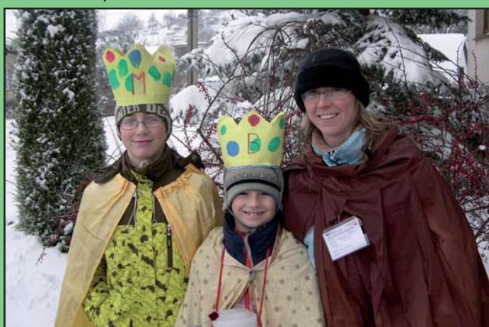
Skupinka koledníků Tříkrálové sbírky