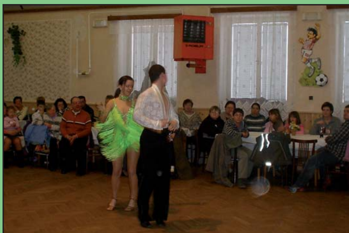
Taneční variace skupiny Single na dětském společenském plese