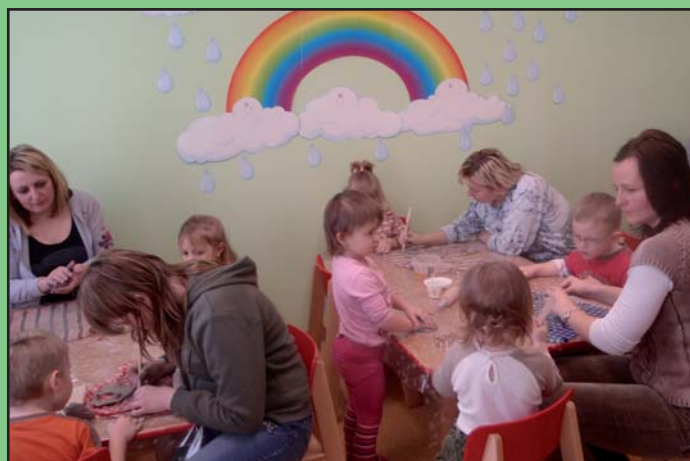
Velikonoční keramické odpoledne v MŠ