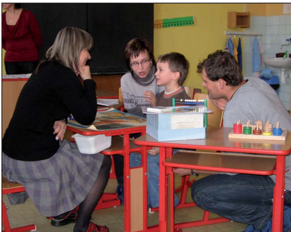
Zápis dětí do prvního ročníku základní školy