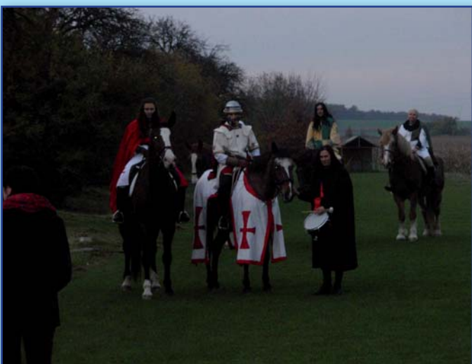
Svatý Martin přijel do naší obce