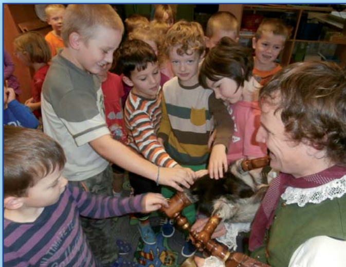
Návštěva dudáka v mateřské škole

Únanovské novinky č. 4/2014 (toto číslo vyšlo v prosinci 2014) povoleno Ministerstvem kultury ČR pod reg. MK ČR E 11693 vydavatel Obec Únanov, 671 31 Únanov 463, IČO 293725, odp. vedoucí Ing. Vojtěch Fabík, místo vydání OÚ Únanov, tel. 515 228 617, fax 515 228 704, e-mail: info@obecunanov.cz , www.obecunanov.cz Vychází čtvrtletně. Uzávěrka příštího čísla – 12. 3. 2015. Náklad 500 ks. Grafika a tisk: Petr Brázda - vydavatelství Břeclav. Redakce si vyhrazuje právo na úpravu některých příspěvků.