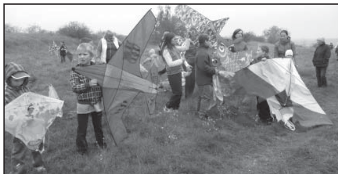
Drakiáda na Velkém kopci

Tak jako každý rok, tak i letos se pořádala 4. října na Velkém kopci v Únanově především pro naše mladé spoluobčany drakiáda. Zúčastnila se jí nejen spousta dětí, ale i rodičů a ostatních rodinných příslušníků. Bohužel nám letos počasí moc nepřálo, ale i přesto bych tuto akci považoval za vydařenou. Děti si s mírným deštěm nelámaly hlavu a pouštěly draky jednoho za druhým. Pro ty, kterým byla zima, byl připravený lahodný čaj.