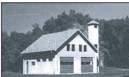
Vizualizace nové hasičské zbrojnice

S firmou Atlanta z Nového Šaldorfa, která podala nejlepší nabídku na výstavbu hasičárny, byla smlouva o dílo podepsána 5. listopadu a současně bylo předáno staveniště. Stavba hasičárny tak byla zahájena. Objekt hasičské zbrojnice je navržen jako dvoutakt s dvěma garážovými stánky pro hasičská auta. Zděný objekt je o dvou podlažích, přízemí a podkroví, se sedlovou střechou a taškovou krytinou. Součástí objektu je hasičská věž pro sušení hadic, která má výšku 12 metrů. Garážová stání jsou navržena pro vozidla Tatra 815 CAS a požární vozidlo Avia. Stavba je navržena z cihlového zdiva 30 cm s termopláštěm cca 20 cm. Věž ze štípaných betonových plotovek v šedobílé přírodní barvě. Půdorysně je objekt velikosti 14x11,5 m. Vstup do objektu je buď přes garážová vrata, nebo bočním vstupem. V přízemí je šatna hasičů, z které se jde do garáží. Z chodby je vstup do sociálního zařízení. V podkroví je umístěna klubovna hasičů, kancelář a sociální zařízení. Smluvní termín dokončení je konec listopadu 2015, náklady na stavbu činí 6 894 tisíc korun.