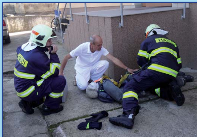
Oživování osoby v bezvědomí při prověřovacím cvičení ve škole