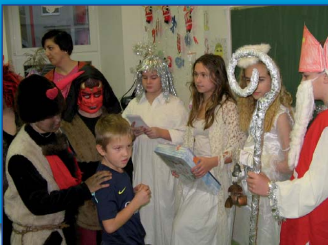
Mikulášská nadílka ve škole