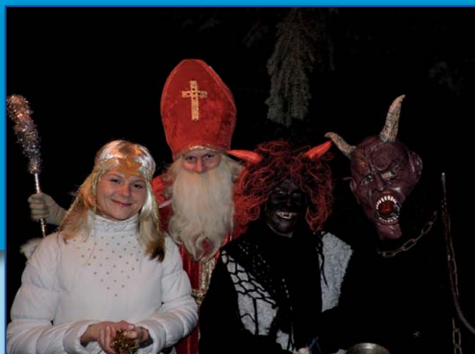
Také letos jste mohli potkat čerta s Mikulášem