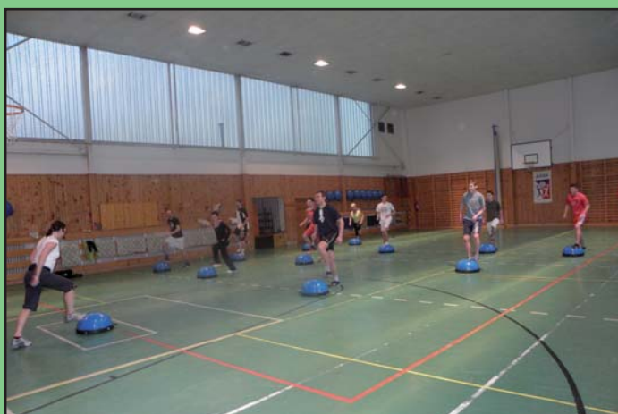
Fotbalisté si udržují fyzickou kondici i aerobním cvičení na Bosu