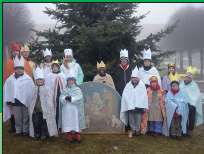
Skupinky koledníků Tříkrálové sbírky