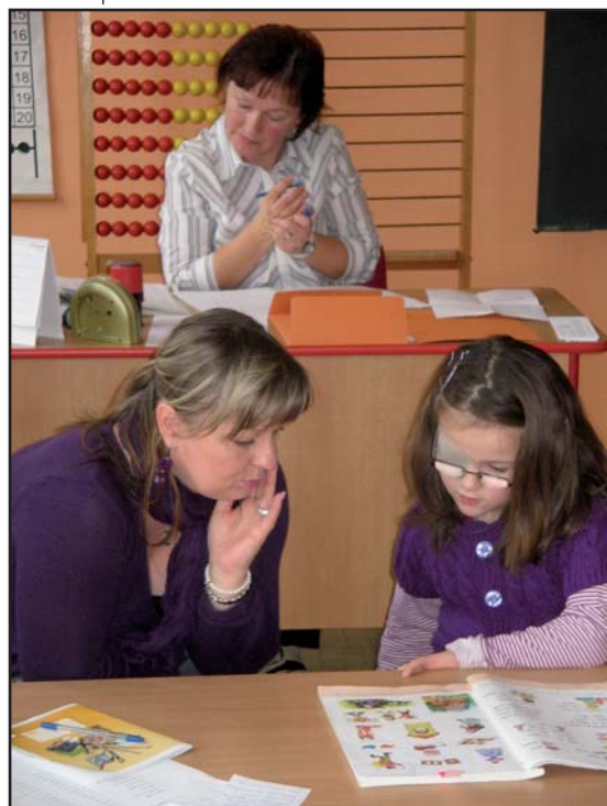
Zápis dětí do prvního ročníku základní školy