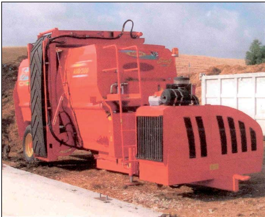
Nízkootáčkový drtič SEKO SAMURAJ poháněný vlastním motorem Perkins zaručuje vysokou výkonnost i v případě práce s velmi obtížně drtitelnými materiály