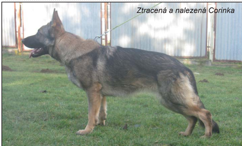
Ztracená a nalezená Corinka