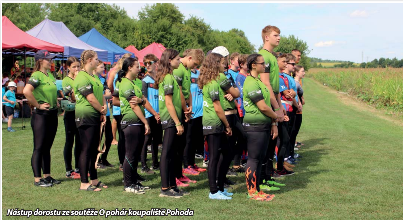
Nástup dorostu ze soutěže O pohár koupaliště Pohoda

úrovni nejlepších týmů okresu Znojmo. Chceme na tomto místě poděkovat nejen trenérům, ale i všem rodičům a dětem za jejich aktivní přístup – díky tomu je o hasičskou budoucnost v Únanově dobře postaráno.