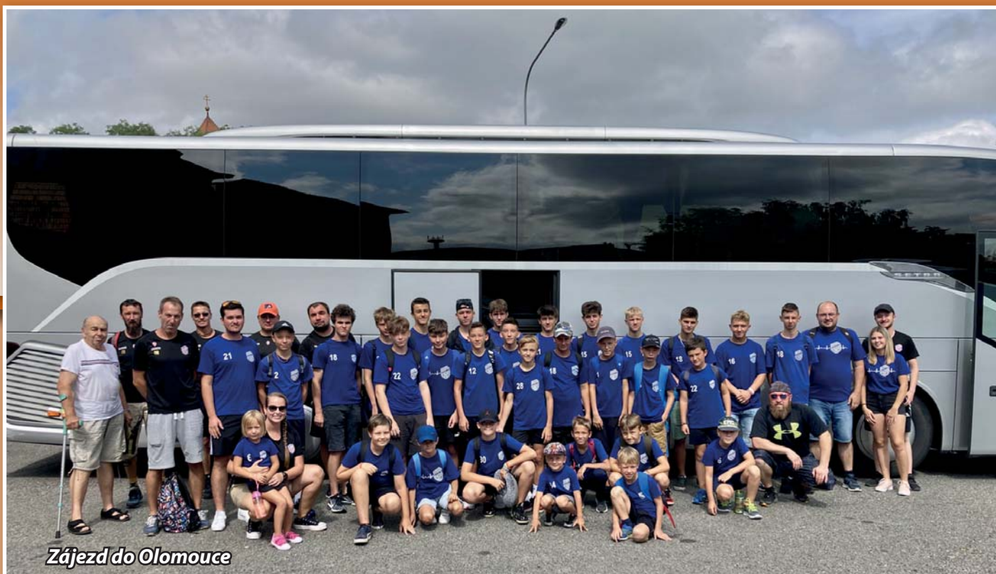
Zájezd do Olomouce