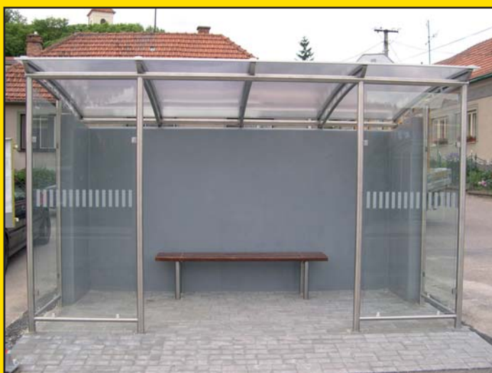
Místní firma Premont vyrobila nové autobusové čekárny