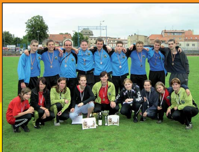
SDH Únanov získal dvakrát stříbrné ocenění v okresním kole