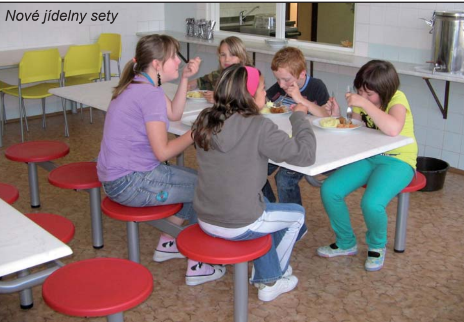
Nové jídelny sety