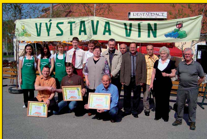
Setkání přátel vín