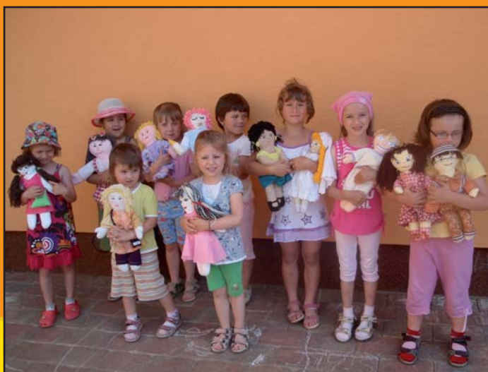
Holčičky s vyrobenými panenkami v rámci akce Unicef „Adoptuj panenku a zachrániš dítě“