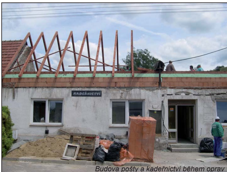
Budova pošty a kadeřnictví během oprav

Při probíhající opravě této obecní budovy bylo jedním z našich cílů omezit provoz pošty na nejkratší možnou dobu. To se nakonec podařilo a poštovní služby byly omezeny pouze 14 dní. Během této krátké doby byla v místnostech pošty vyměněna okna, zhotoveny nové elektrické rozvody, opraveno sociální zařízení, vymalováno a položeno nové linoleum. Linoleum v místnosti pro zákazníky bude vyměněno až po opravě celé budovy, aby nedošlo k jeho poškození. Také provoz kadeřnictví by měl být obnoven počátkem měsíce července. Dokončení přístavby zadní části budovy a fasády celé budovy je reálné v měsíci září.