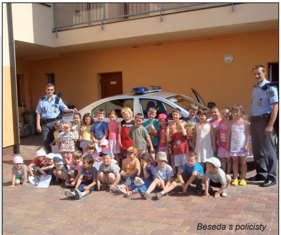
Beseda s policisty