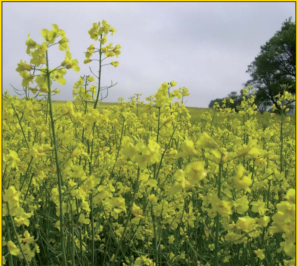
Přidávání bioethanolu do pohonných hmot zvýšilo plochy oseté řepkou také v naší obci