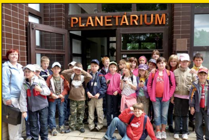
Školní výlet do Planetária