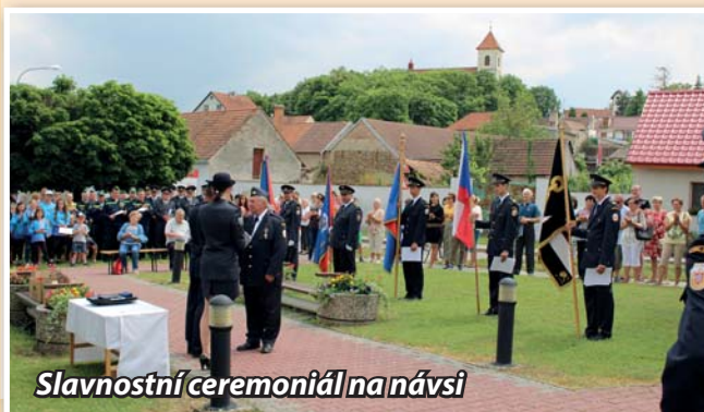
Slavnostní ceremoniál na návsi