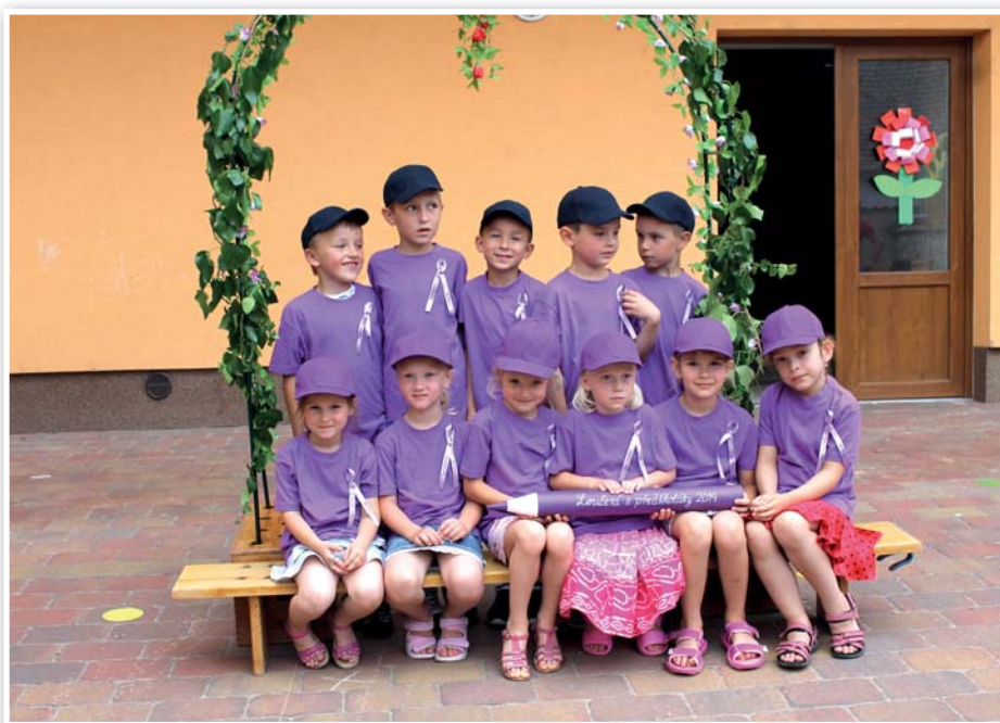
Loučení s předškoláky

Mimo toho všeho probíhají v týdenní nebo čtrnáctidenních intervalech témata – jarní květiny, poslové jara, odpadky kolem nás, naše zvířátka, život v lese, na louce, u rybníka, motýlek, život včel, doprava ad.