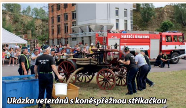
Ukázka veteránů s koněspřežnou stříkačkou