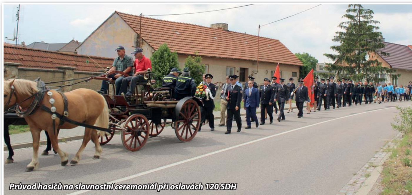
Průvod hasičů na slavnostní ceremoniál při oslavách 120 SDH

Starosta SDH a velitel JPO Únanov www.facebook.com/hasiciunanov