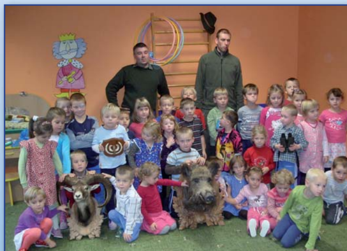
Beseda s myslivci ve školce