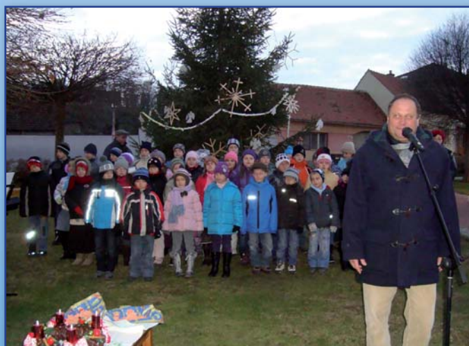
Zahájení adventu na návsi