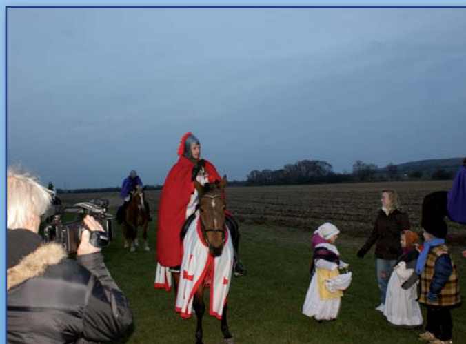
Sv. Martin přijel i do Únanova

Únanovské novinky č. 4/2012 (toto číslo vyšlo v prosinci 2012) povoleno Ministerstvem kultury ČR pod reg. MK ČR E 11693 vydavatel Obec Únanov, 671 31 Únanov 116, IČO 293725, odp. vedoucí Ing. Vojtěch Fabík, místo vydání OÚ Únanov, tel. 515 228 617, fax 515 228 704, e-mail: info@obecunanov.cz, www.obecunanov.cz Vychází čtvrtletně. Uzávěrka příštího čísla – 7. března 2013. Náklad 480 ks. Grafika a tisk: Petr Brázda - vydavatelství Břec-lav. Redakce si vyhrazuje právo na úpravu některých příspěvků.