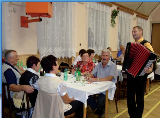
Setkání seniorů v měsíci září