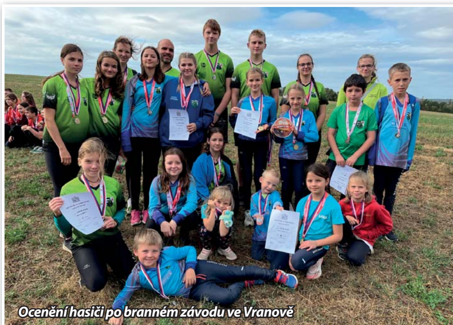
Ocenění hasiči po branném závodu ve Vranově

z Vranova nad Dyjí odvezli dvě zлата z kategorií dorostenek a mladších žáků. Díky tomuto výkonu obě družstva postoupila do krajského kola, které proběhlo 4. listopadu ve Vra-