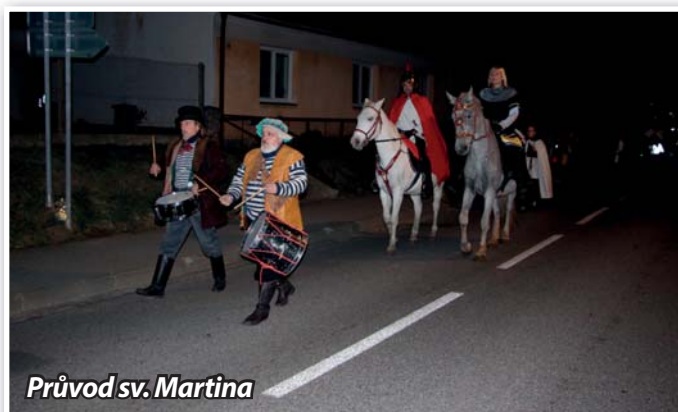
Průvod sv. Martina