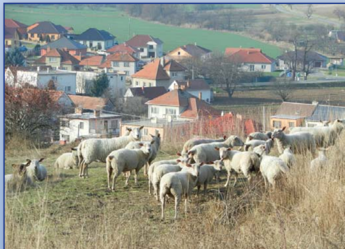
Pasoucí se ovce na Velkém kopci

Únanovské novinky č. 4/2013 (toto číslo vyšlo v prosinci 2013) povoleno Ministerstvem kultury ČR pod reg. MK ČR E 11693 vydavatel Obec Únanov, 671 31 Únanov 463, IČO 293725, odp. vedoucí Ing. Vojtěch Fabík, místo vydání OÚ Únanov, tel. 515 228 617, fax 515 228 704, e-mail: info@obecunanov.cz, www.obecunanov.cz Vychází čtvrtletně. Uzávěrka příštího čísla – 7. března 2014. Náklad 480 ks.