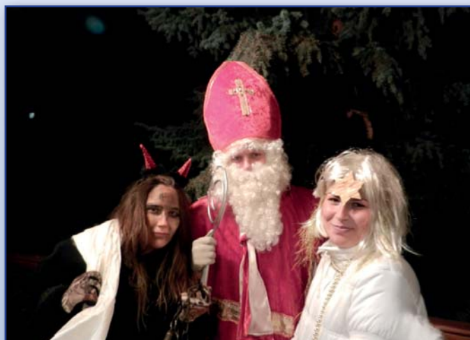
Mikuláš s čertem navštívili také starostu obce