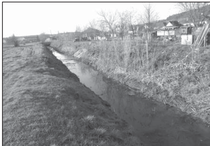
Vyčištěný úsek potoka