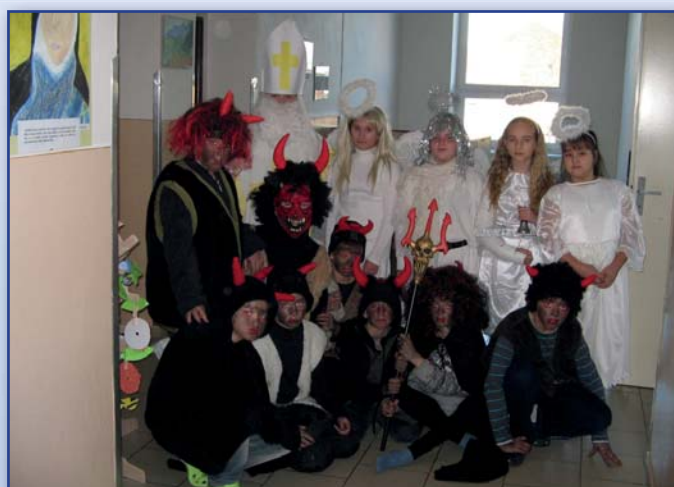
Mikulášská nadílka v základní škole