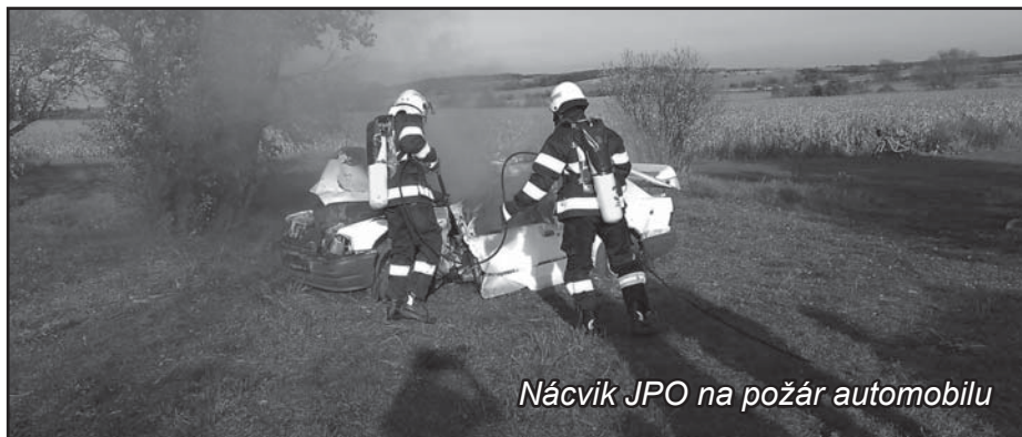
Nácvik JPO na požár automobilu