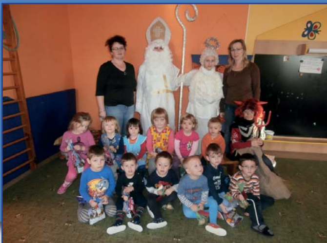
Mikulášská nadílka v mateřské škole