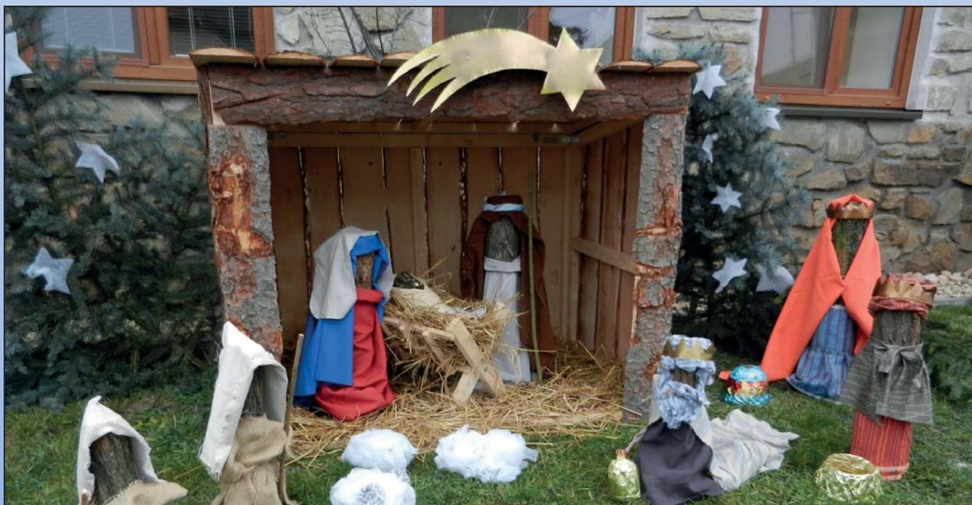
V době adventní byl před budovou mateřské školy postaven krásný betlém

Příjemné prožití svátků vánočních, mnoho štěstí, zdraví a úspěchů v roce 2014 přeji zastupitelé obce a zaměstnanci obecního úřadu.