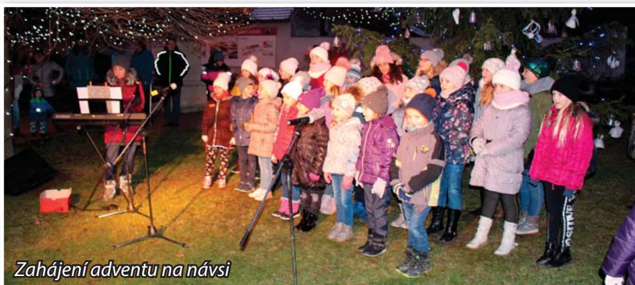
Zahájení adventu na návsi