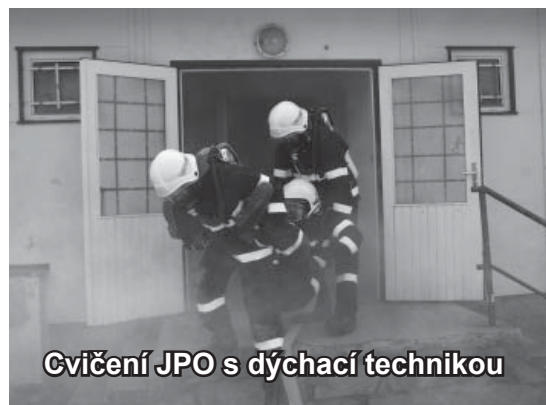
Gvičení JPO s dýchací technikou