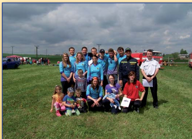
Družstva mužů a žen po vítězství na okrskovém kole v Kuchařovicích