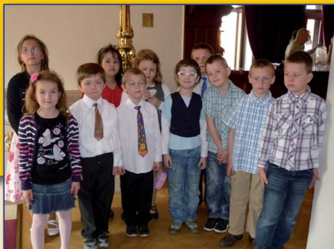
Návštěva znojemského divadla