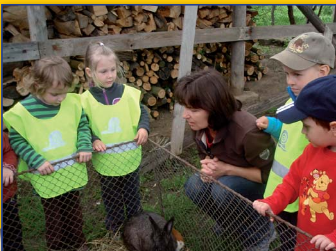
Děti z MŠ na návštěvě farmy u Marků