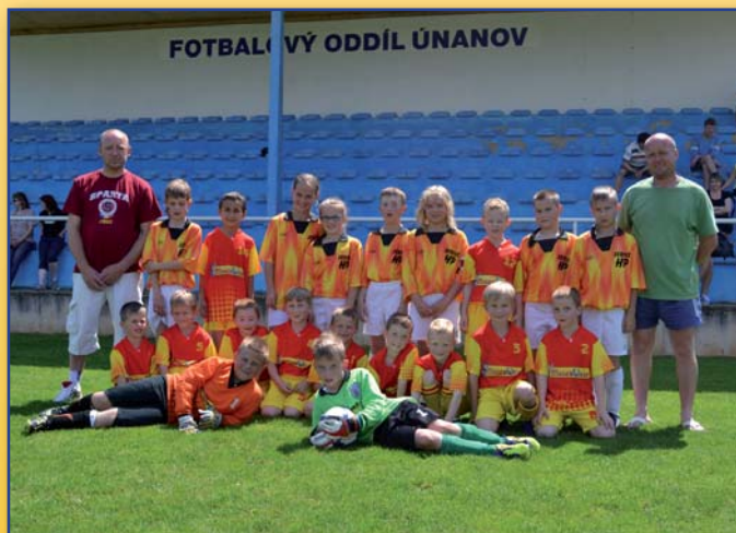
Týmy A a B přípravy Únanov

Únanovské novinky č. 2/2013 (toto číslo vyšlo v červnu 2013) povoleno Ministerstvem kultury ČR pod reg. MK ČR E 11693 vydavatel Obec Únanov, 671 31 Únanov 463, IČO 293725, odp. vedoucí Ing. Vojtěch Fabík, místo vydání OÚ Únanov, tel. 515 228 617, fax 515 228 704, e-mail: info@obecunanov.cz, www.obecunanov.cz Vychází čtvrtletně. Uzávěrka příštího čísla – 13. září 2013. Náklad 480 ks. Grafika a tisk: Petr Brázda - vydavatelství Břeclav. Redakce si vyhrazuje právo na úpravu některých příspěvků.