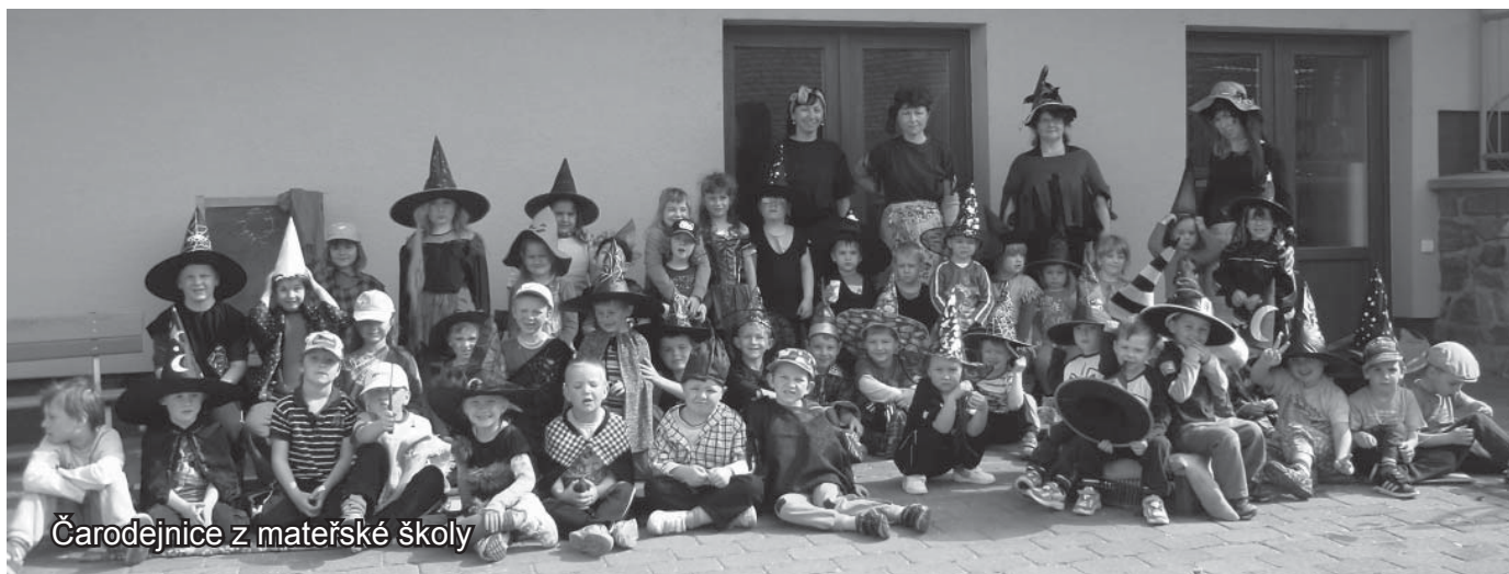
Čarodějnice z mateřské školy