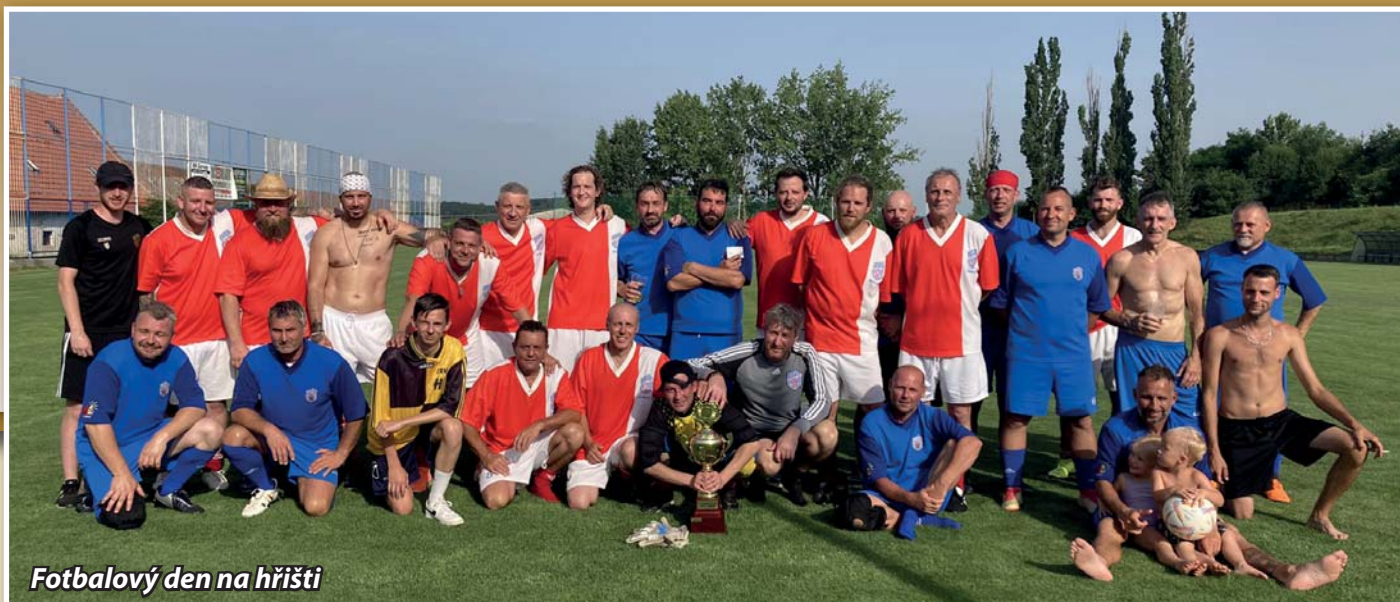
Fotbalový den na hřišti