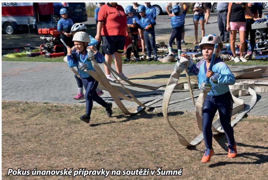
Pokus únanovské přípravky na soutěži v Šumné