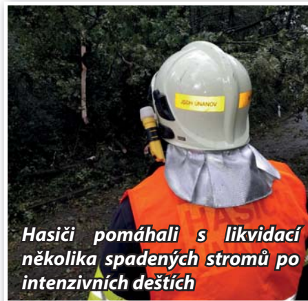
Hasiči pomáhali s likvidací několika spadených stromů po intenzivních deštích