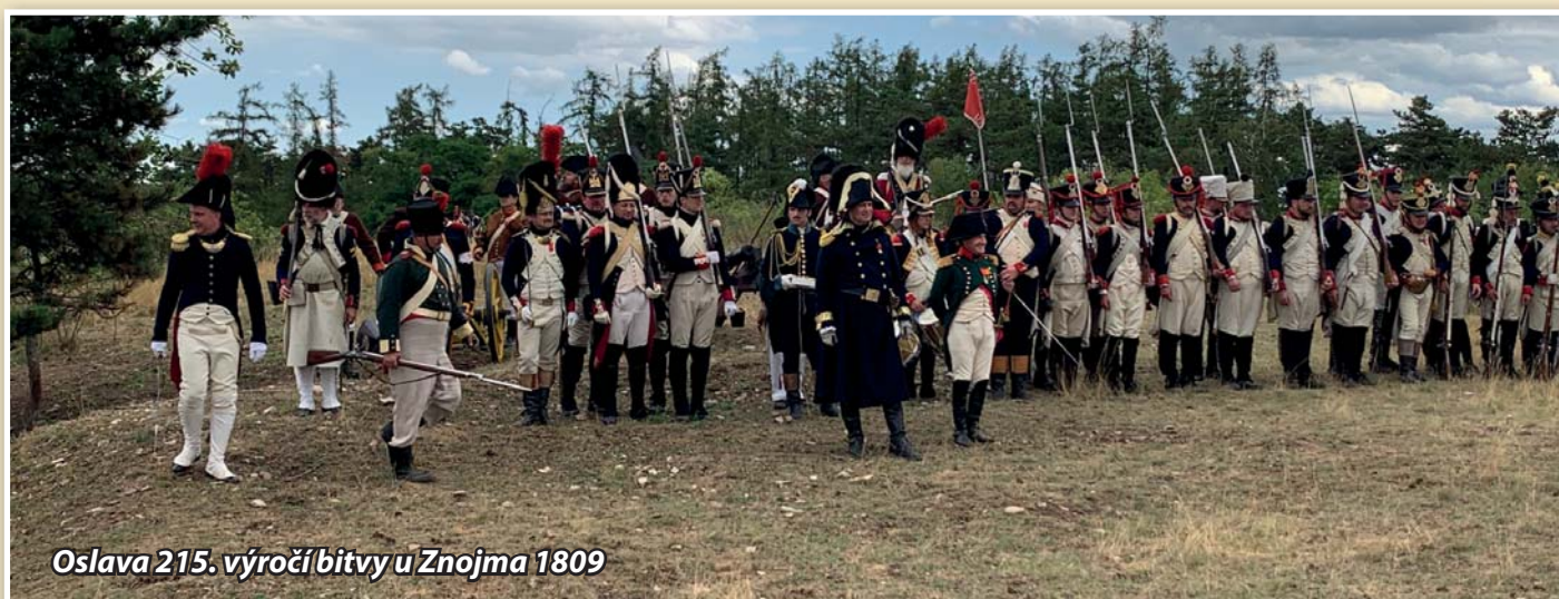
Oslava 215. výročí bitvy u Znojma 1809