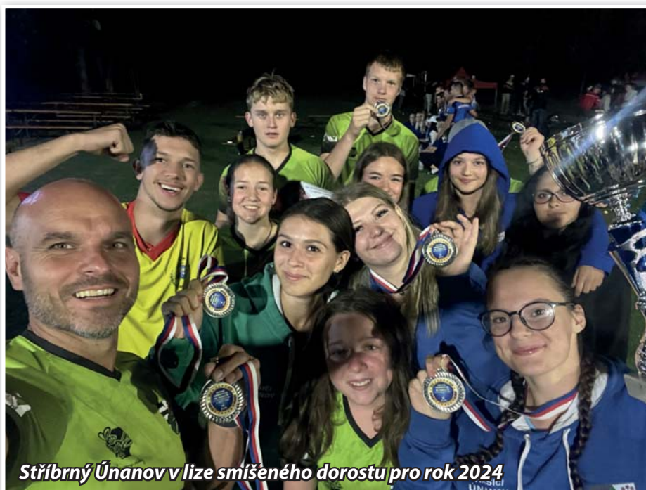
Stříbrný Únanov v lize smíšeného dorostu pro rok 2024