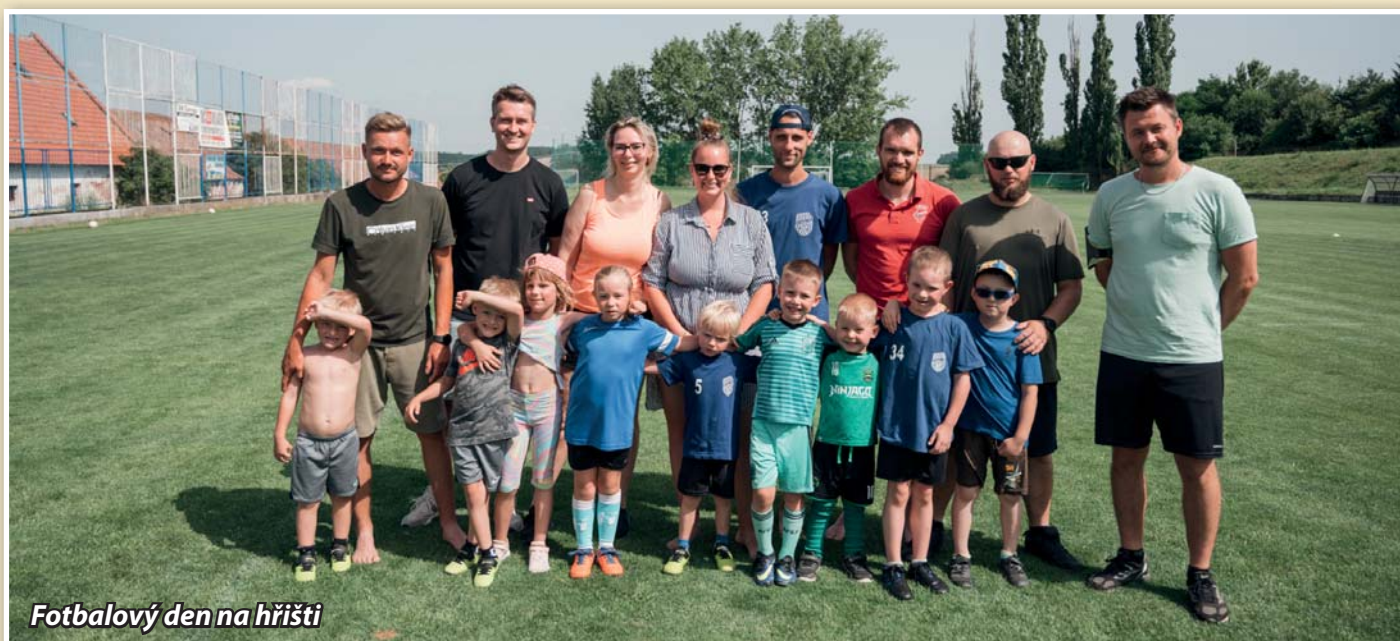
Fotbalový den na hřišti