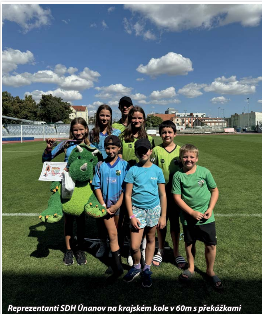
Reprezentanti SDH Únanov na krajském kole v 60m s překážkami