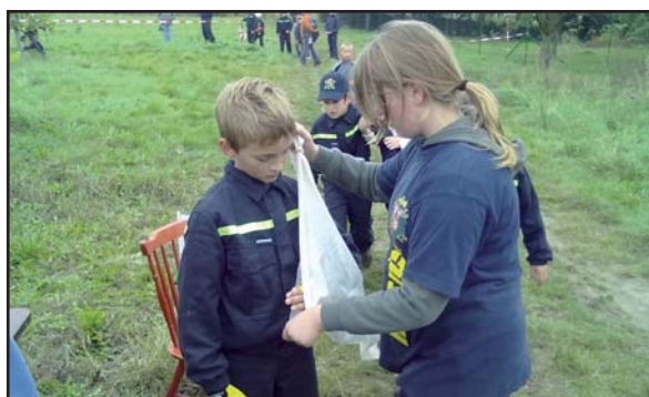
Kontrolní stanoviště „zdravověda“ při závodě požární všestrannosti mladších žáků