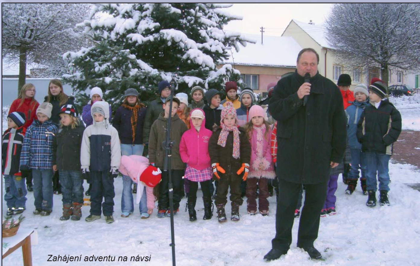
Zahájení adventu na návsi

PŘÍJEMNÉ PROŽITÍ SVÁTKŮ VÁNOČNÍCH, MNOHO ŠTĚSTÍ, ZDRAVÍ A ÚSPĚCHŮ V ROCE 2011 PŘEJÍ ZAMĚSTNANCI OBECNÍHO ÚŘADU.