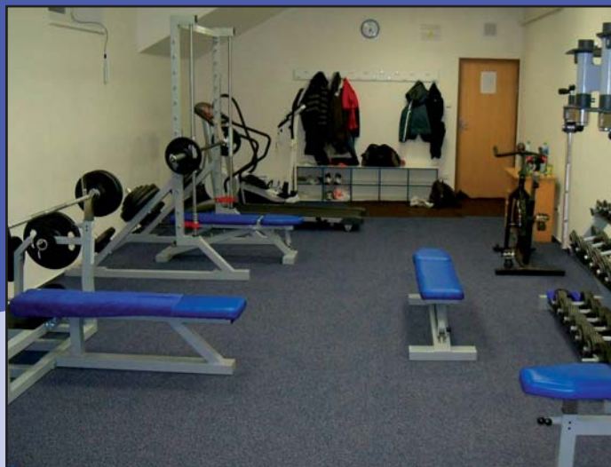
Sportovní vybavení posilovny v Orlovně