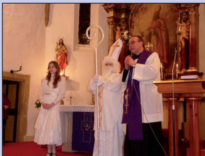
Mikulášská nadílka v kostele