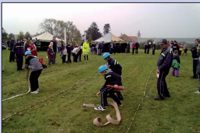
Napojování hydrantového nástavce při štafetě požárních dvojic starších žáků