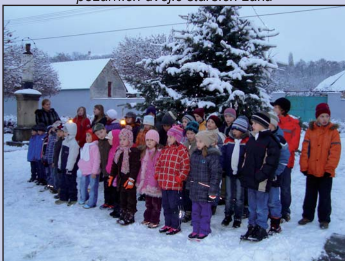
Rozsvěcování adventního stromu