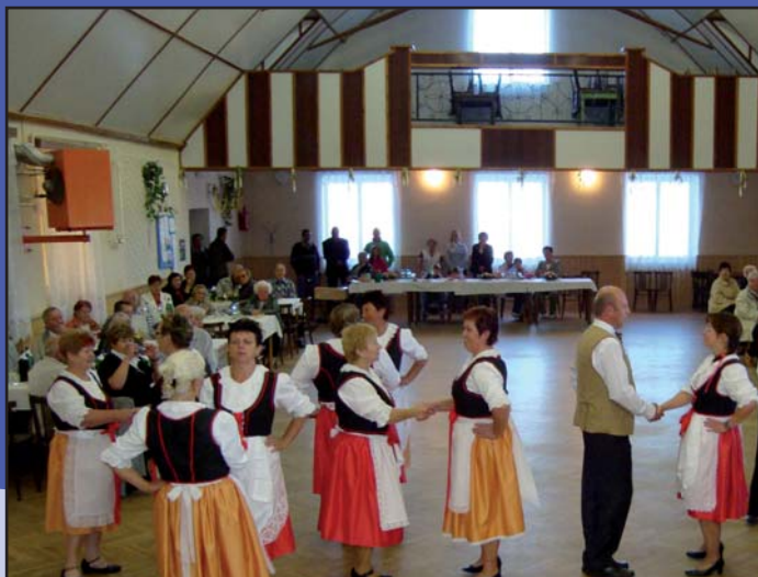
Vystoupení tanečního souboru „Naši sousedé z Chvalovic“ na setkání seniorů