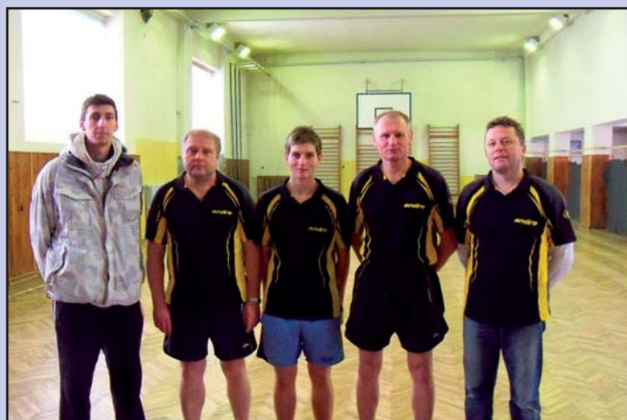
Hráči „A“ mužstva ve stolním tenise