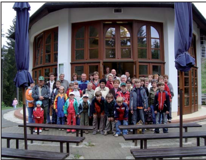
Účastníci zájezdu na Turzovku