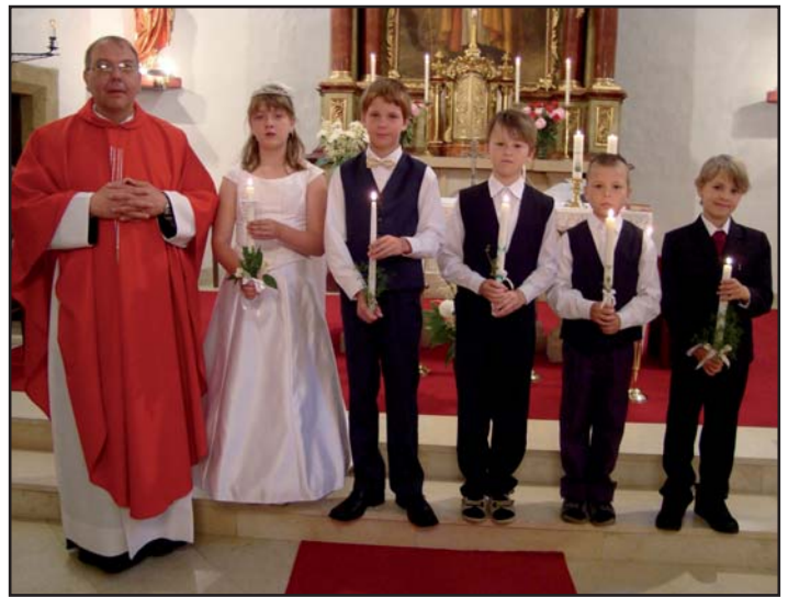
První svatě přijmání