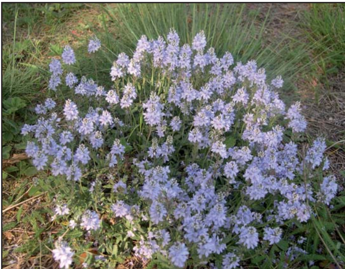
V měsíci květnu vykvetla na Velkém kopci mateřídouška