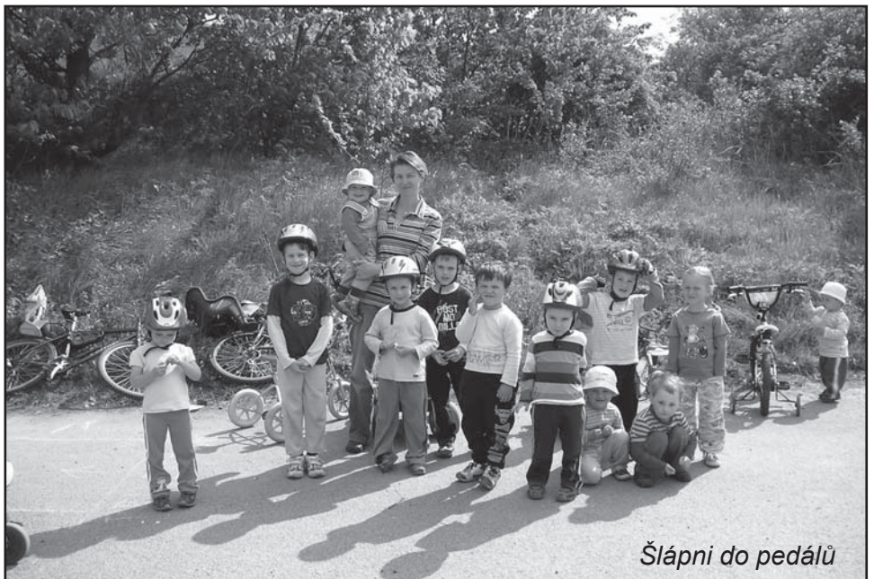
Šlápni do pedálů