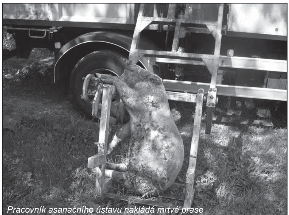
Pracovník asanačního ústavu nakládá mrtvé prase

I když černých skládek v posledních letech podstatně ubylo, přesto někdy najdeme v přírodě hromádky odpadů. Ale najít vyhozené mrtvé prase domácí se nám nepovede každý den. Tato skutečnost nám byla nahlášena na počátku měsíce května. Bylo nalezeno ve vrbové aleji pod kaolinkou. Váha zhruba 50 kg. Situaci jsme řešili s veterinární správou a následně s veterinárním asanačním ústavem, který prase odvezl. V tomto případě se jedná o přestupek, který jsme však ani nenahlásili. Pachatel by se těžko našel a obci nebyla způsobena vysoká škoda. Za likvidaci prasete jsme zaplatili necelých čtyři sta korun.