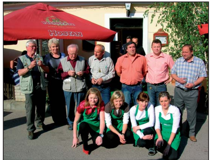
Výstava přátel vín v Únanově